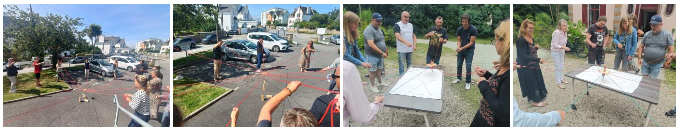
Découverte de jeux coopératifs

De nombreuses ressources sont téléchargeables et imprimables en cliquant sur les liens du diaporama.